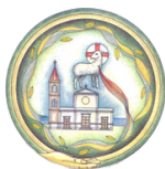
Parrocchia Santissimo Salvatore