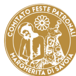
Comitato Feste Patronali